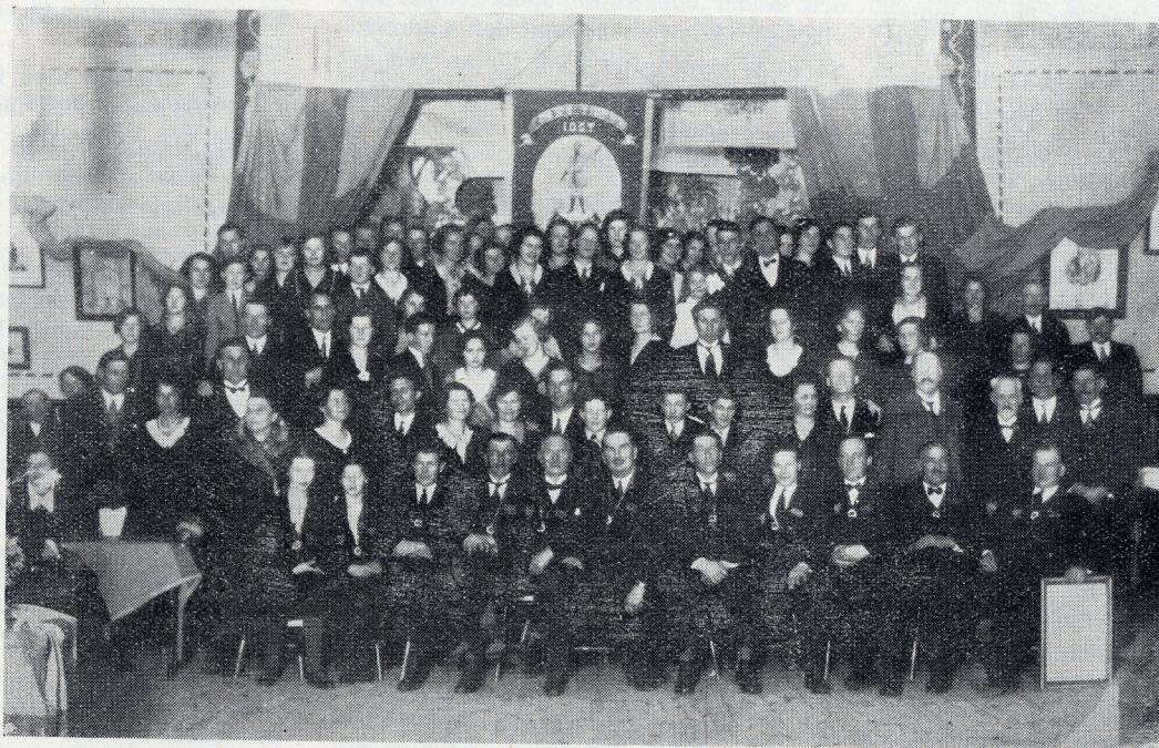
Logen 264 Stridshjälten, Värsta.