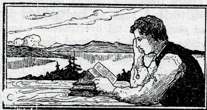
Bakom lyckta dörrar av N. S. NORLING. Eklunds förlag. Kr. 4: 50.

Så inleder ordföranden: Jaha, vi måste börja, ändå vi äro så få här. Det är sorgligt, att folk så lite bryr sig om denna viktiga fråga, när vi ända från Alvesta hämtat aftonens talare. Men vore vi på bio, så skulle vi få se på folk. Det